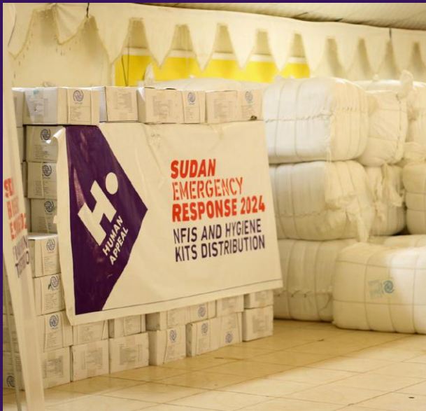
Kits d'hygiène stockés dans des entrepôts.