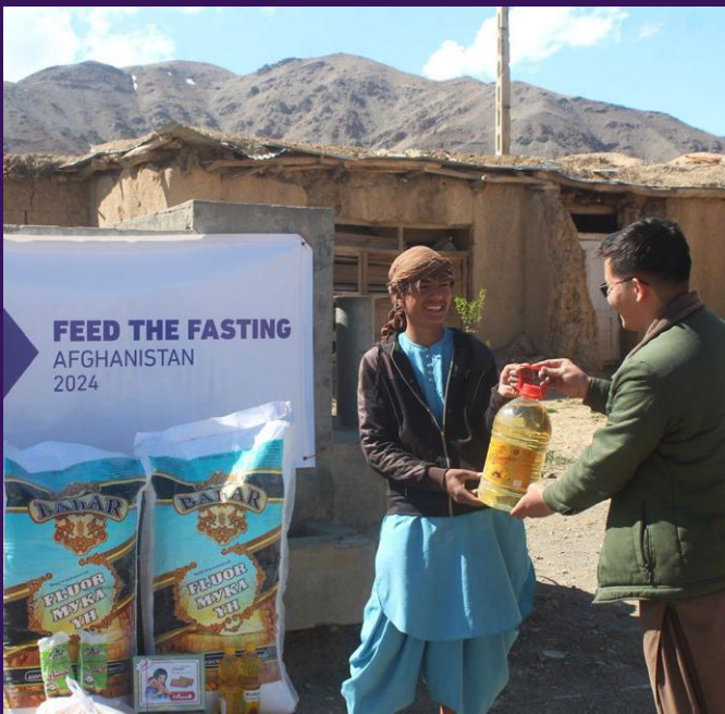
Distribution de colis alimentaires en Afghanistan.