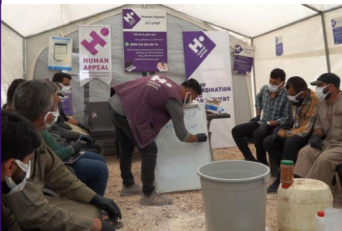
Session de formation professionnelle en cours en Syrie.

Human Appeal a dispensé une formation professionnelle à 200 personnes du village d'Al-Zohoor, hommes et femmes confondus. 40 d'entre eux ont été formés à la maintenance des téléphones portables, 40 à la fabrication d'accessoires, 60 à la pâtisserie et 60 autres à la production de détergents.