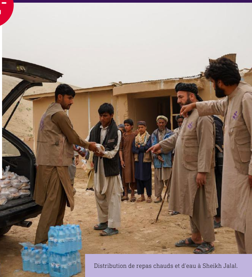
Distribution de repas chauds et d'eau à Sheikh Jalal.

Notre équipe a distribué 500 repas chauds dans le village de Sheikh Jalal aux familles touchées par les inondations. Les inondations ont détruit les maisons, le bétail et les récoltes, laissant de nombreuses familles dans l'impossibilité d'accéder aux cuisines ou aux denrées alimentaires.