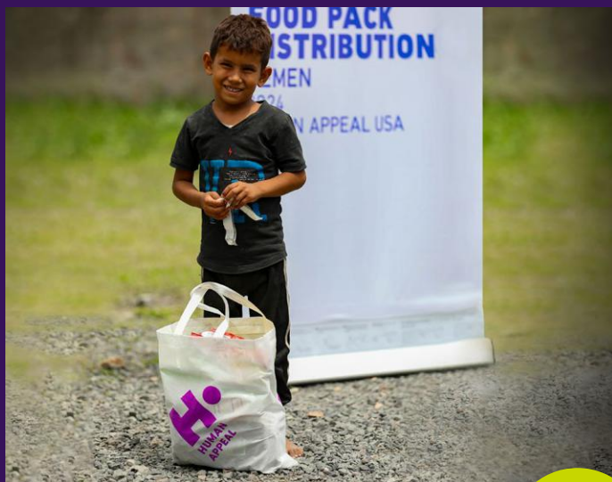
Un enfant avec son colis de nourriture au Yémen.