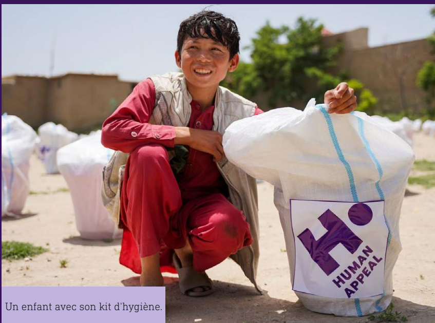
Un enfant avec son kit d'hygiène.

Afin d'améliorer la situation des personnes les plus touchées par les inondations, Human Appeal a distribué des colis alimentaires à 100 familles dans le village de Tadamra Bala, dans la province de Parwan. Chaque colis alimentaire est destiné à une famille pendant un mois et contient de la farine de blé, des biscuits énergétiques, de l'huile végétale et des légumes secs, aidant ainsi les familles à lutter contre la faim.