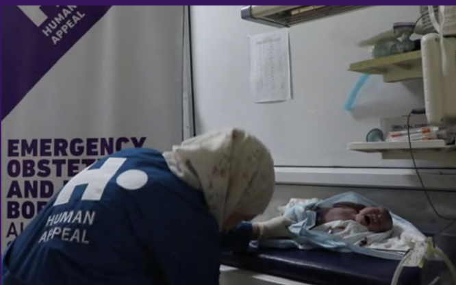
Examen d'un bébé à Al Yasameen.