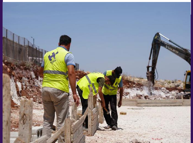
L'école au tout début de sa construction.

Human Appeal est en train de construire une nouvelle école dans le village d'Al-Zohoor, où de nombreux élèves ont du mal à accéder à l'éducation. L'école offrira aux enfants la possibilité d'apprendre et de s'épanouir.