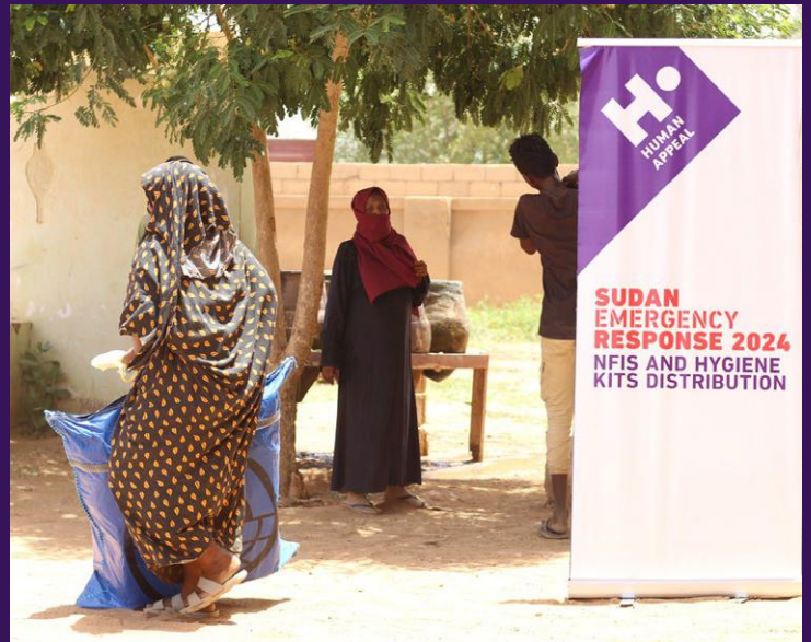
Distribution de kits d'hygiène au Soudan.