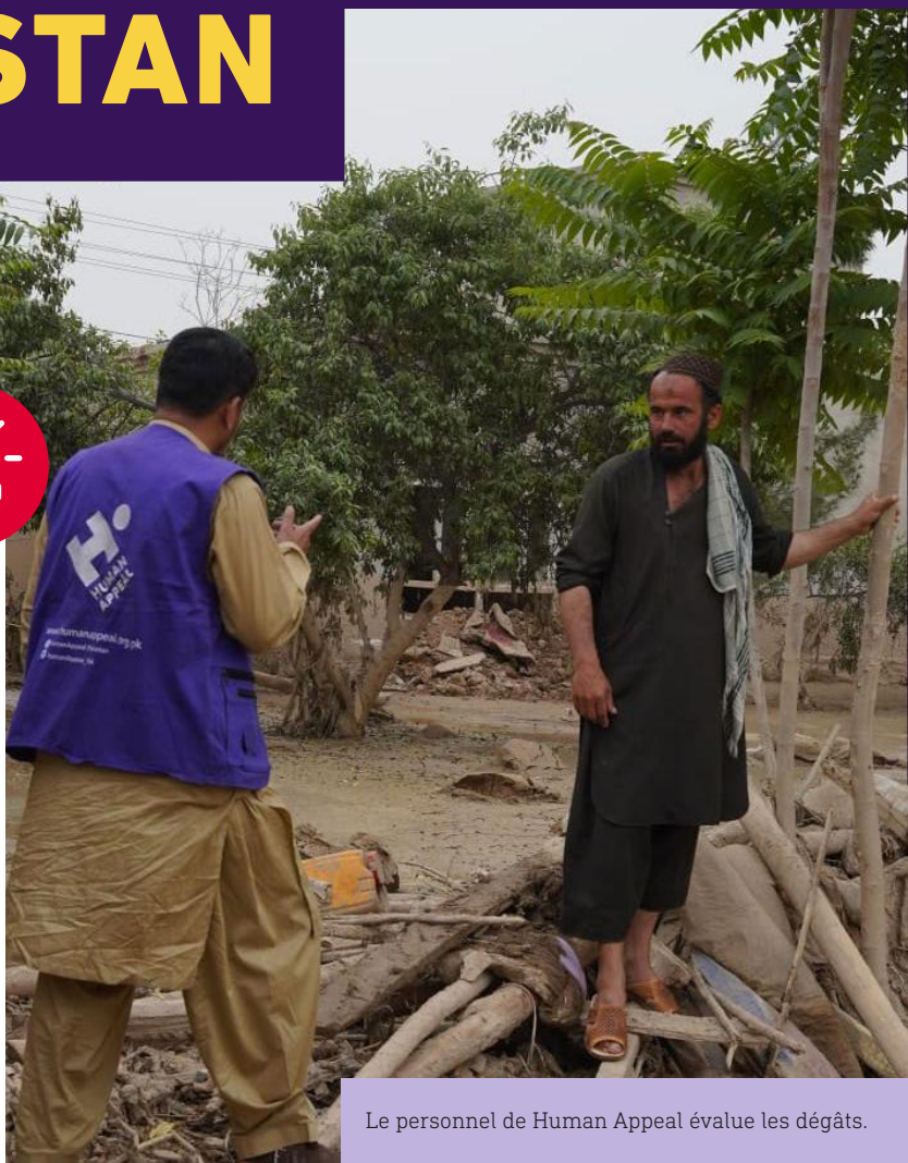
Le personnel de Human Appeal évalue les dégâts.

Suite aux inondations soudaines et dévastatrices en Afghanistan, notre équipe s'est rendue dans la province de Baghlan afin d'évaluer la situation sur le terrain et de contacter les personnes affectées. Nous nous efforçons ainsi d'apporter une aide humanitaire aux populations touchées et de les soutenir après cette catastrophe.