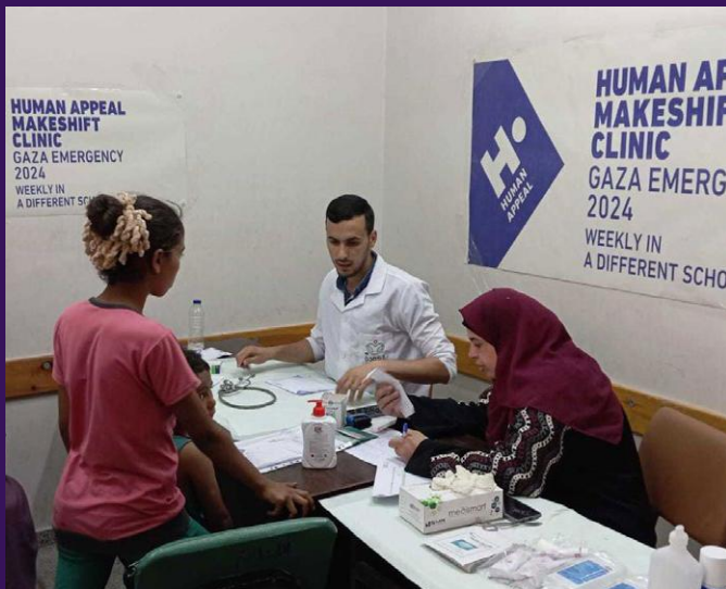
Consultations médicales à la clinique mobile.