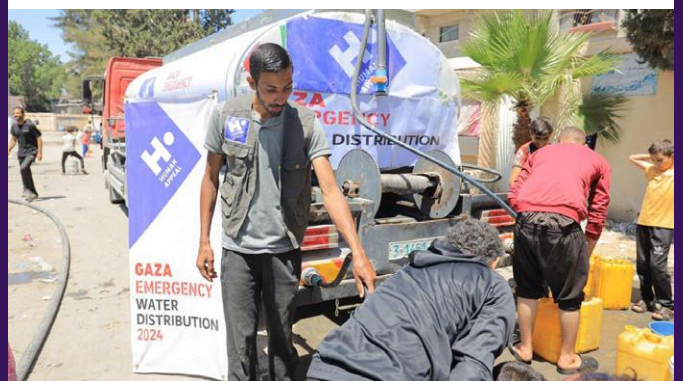
Remplissage des réservoirs d'eau à Gaza.

Notre équipe a distribué 50,000 litres d'eau potable à 1,100 familles palestiniennes déplacées sur six lieux : l'université Al Quds, l'école Arafat pour garçons, l'école Arafat pour filles, Sheikh Radwan - East Bridge, la zone autour de la rue Ahmed Yassin et l'école Amwas, afin qu'elles puissent s'hydrater et rester en bonne santé.