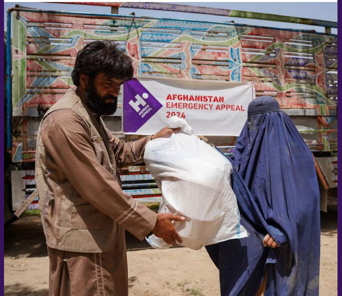
Des sacs d'ustensiles de cuisine distribués aux familles.

Les inondations qui ont frappé l'Afghanistan ont privé de nombreuses familles de cuisines, d'ustensiles ou de matériel de cuisson. Human Appeal a distribué 552 kit de cuisine , s'assurant ainsi que les familles disposent de tout ce dont elles ont besoin. Chaque kit contient des bols, une bouilloire, des assiettes et des tasses, un couteau, une louche, une poêle à frire, une corbeille à fruits, un récipient pour la nourriture et une moustiquaire.