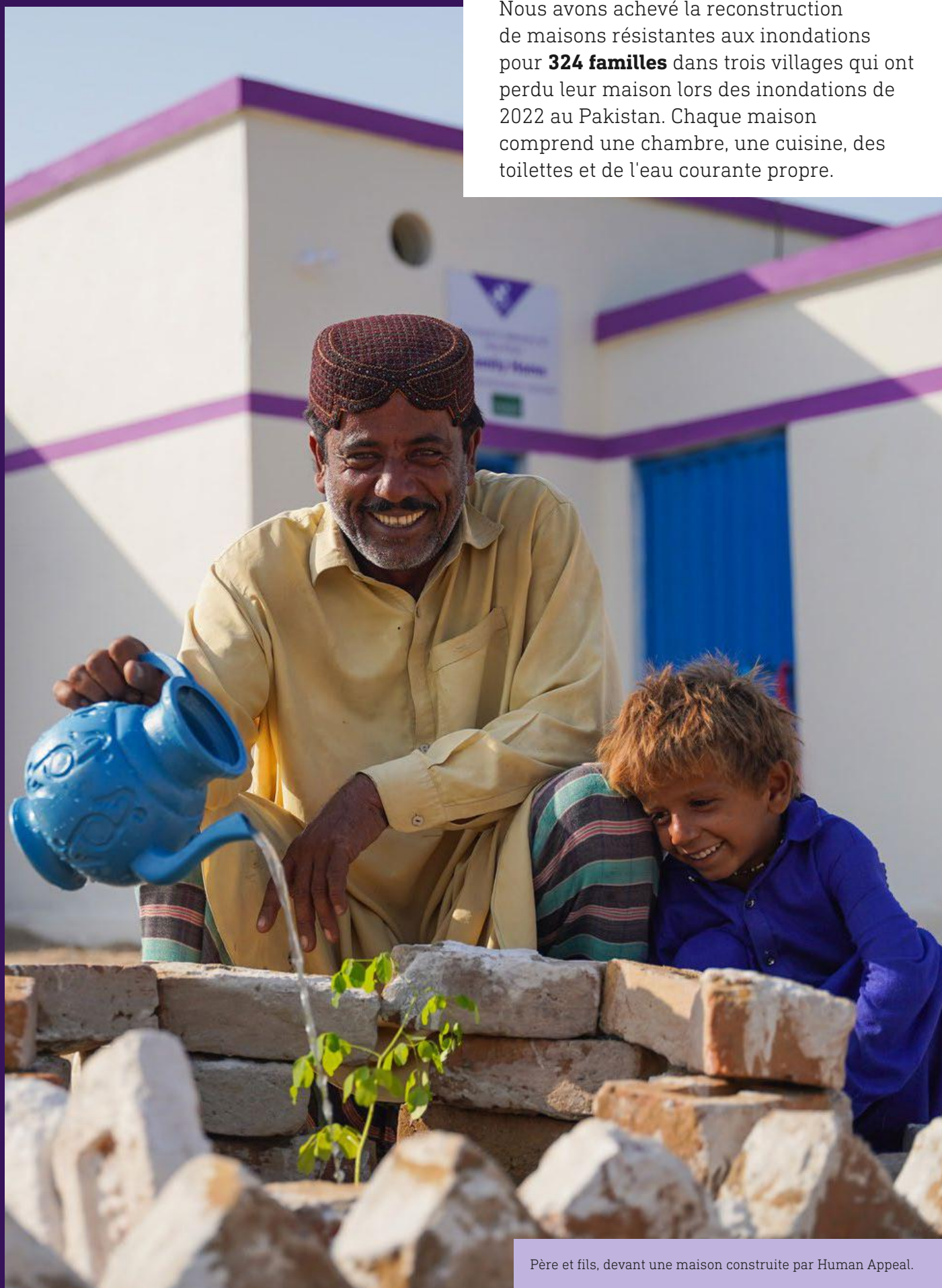
Père et fils, devant une maison construite par Human Appeal.

Nous avons achevé la reconstruction de maisons résistantes aux inondations pour 324 familles dans trois villages qui ont perdu leur maison lors des inondations de 2022 au Pakistan. Chaque maison comprend une chambre, une cuisine, des toilettes et de l'eau courante propre.