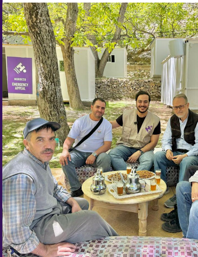
Goûter au cœur des nouvelles habitations aménagées.

Nous avons apporté une aide médicale à 1,200 personnes au Maroc, en proposant des examens médicaux gratuits en transférant les patients à l'hôpital local pour ceux qui n'avaient pas les moyens d'accéder à des soins de santé.