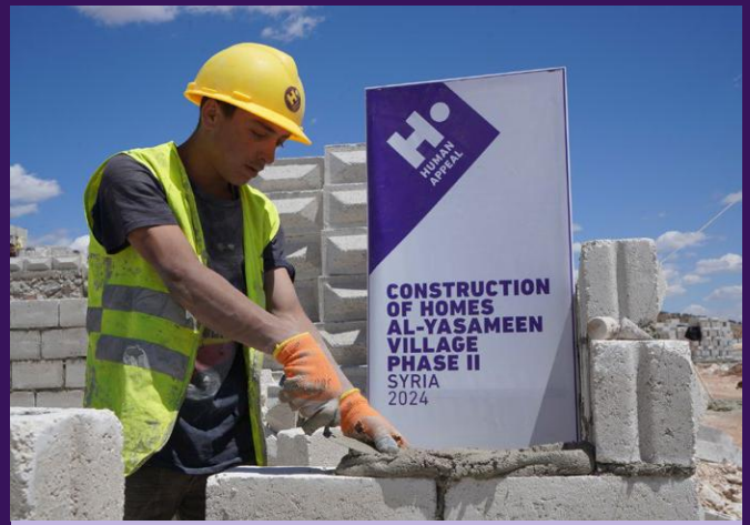
L'un des 500 nouveaux logements en cours de construction

En avril, l'hôpital Al Imaan de Human Appeal a pris en charge un total de 10,960 patients , dont 375 accouchements et 96 césariennes .