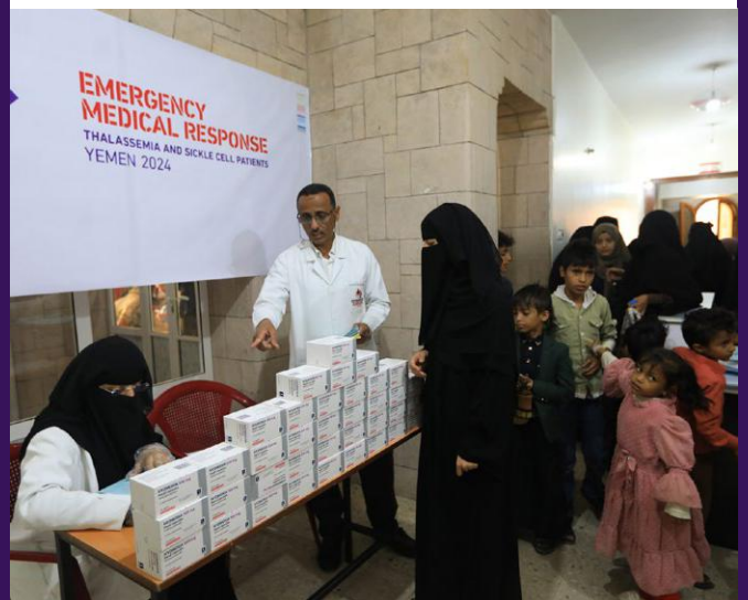
Tri et distribution de matériel médical.

À Sanaa, nous avons distribué des fournitures médicales essentielles à 2,700 patients souffrant de thalassémie et de drépanocytose, palliant ainsi la grave pénurie de médicaments et de fournitures dans les hôpitaux et les centres de soins de santé.