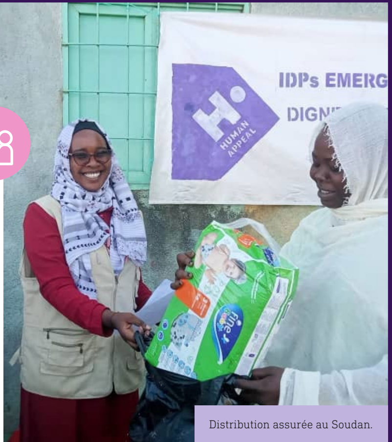
Distribution assurée au Soudan.

Nous avons fourni des bouteilles de lait pour bébé et des paquets de couches aux mères des centres d'Arkaweet, d'Alshima et d'Alnahda pour les familles déplacées au Soudan. En complément, nous avons distribué 70 kits de dignité aux femmes et aux jeunes filles du centre d'Arkaweet, contenant des produits d'hygiène essentiels tels que du dentifrice, du savon, des brosses à dents et des serviettes hygiéniques, ainsi que d'autres articles nécessaires à l'hygiène.