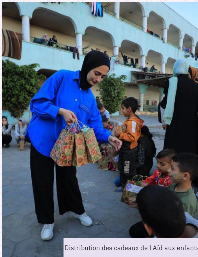
Distribution des cadeaux de l'Aïd aux enfants