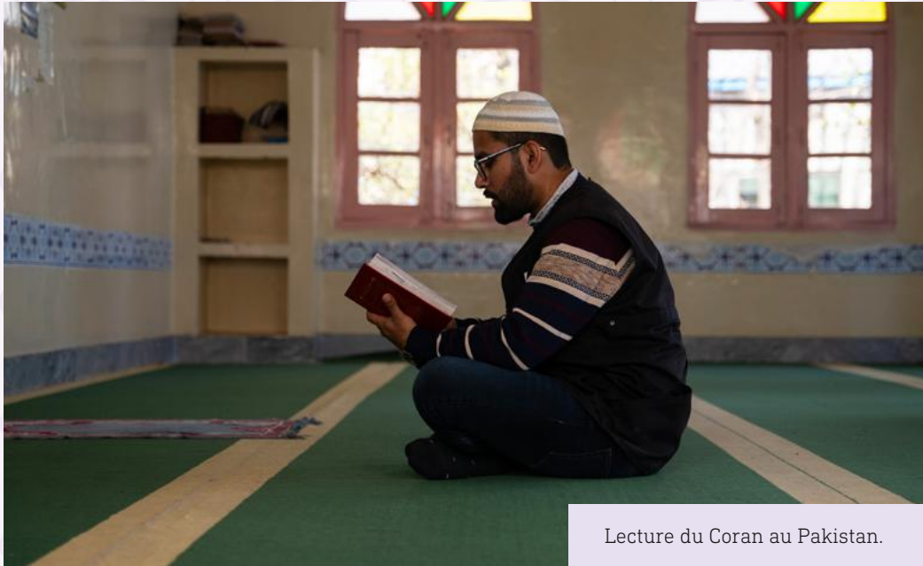
Lecture du Coran au Pakistan.