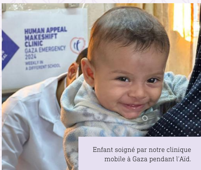
Enfant soigné par notre clinique mobile à Gaza pendant l'Aïd.