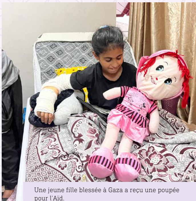
Une jeune fille blessée à Gaza a reçu une poupée pour l'Aïd.