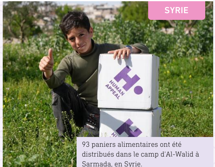
93 paniers alimentaires ont été distribués dans le camp d'Al-Walid à Sarmada, en Syrie.