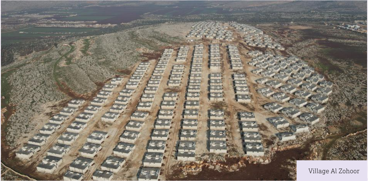
Village Al Zohoor