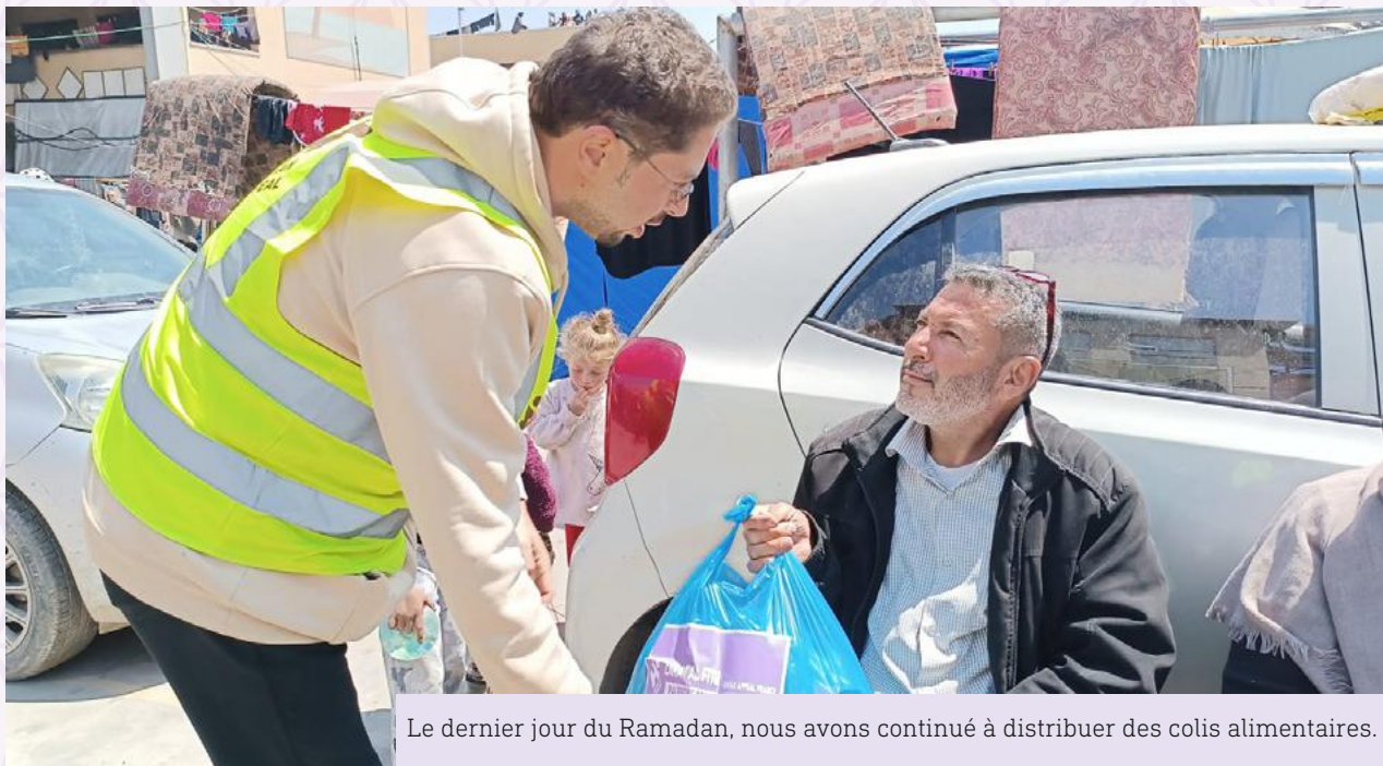
Le dernier jour du Ramadan, nous avons continué à distribuer des colis alimentaires.