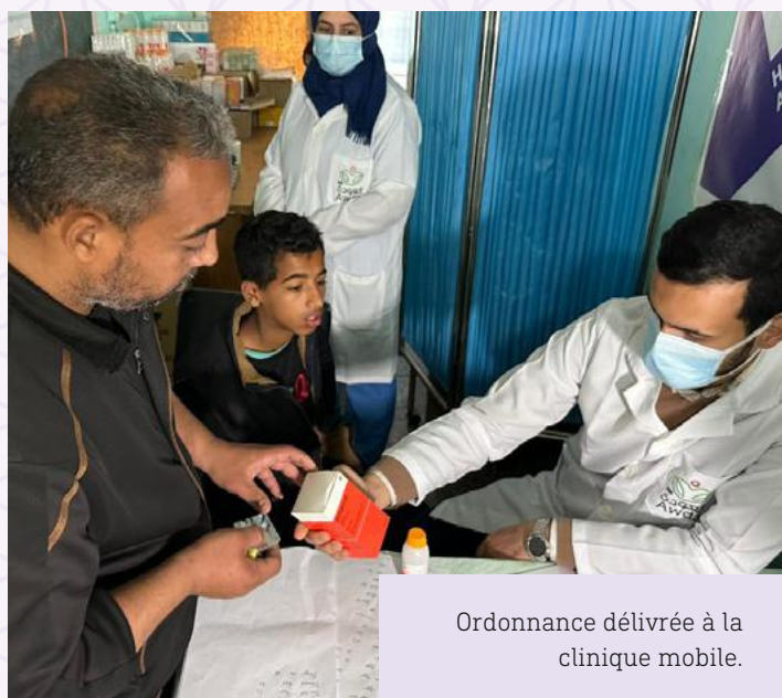
Ordonnance délivrée à la clinique mobile.