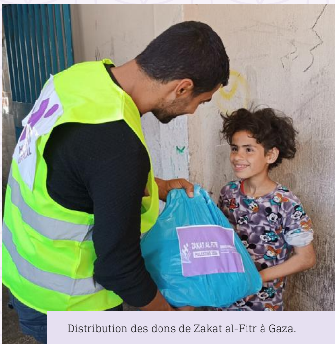
Distribution des dons de Zakat al-Fitr à Gaza.