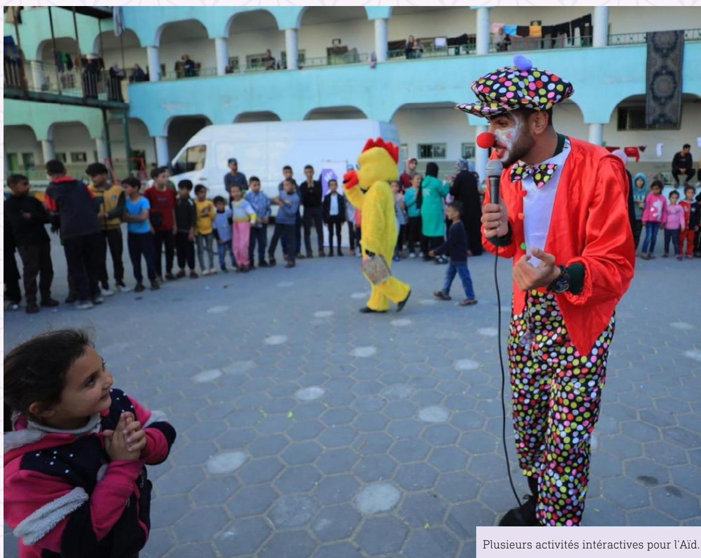
Plusieurs activités interactives pour l'Aïd.