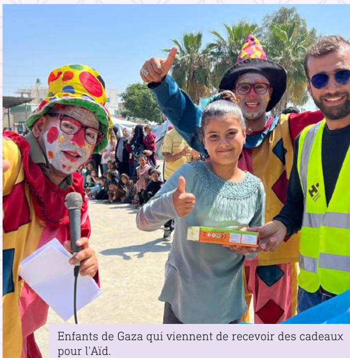
Enfants de Gaza qui viennent de recevoir des cadeaux pour l'Aïd.