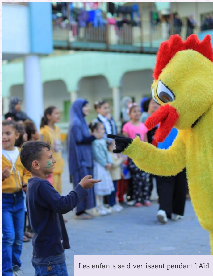
Les enfants se divertissent pendant l'Aïd