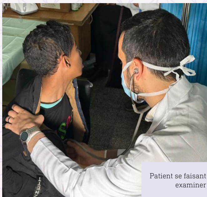
Patient se faisant examiner