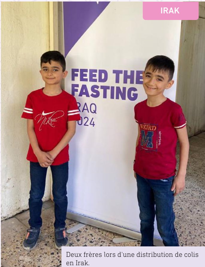
Deux frères lors d'une distribution de colis en Irak.