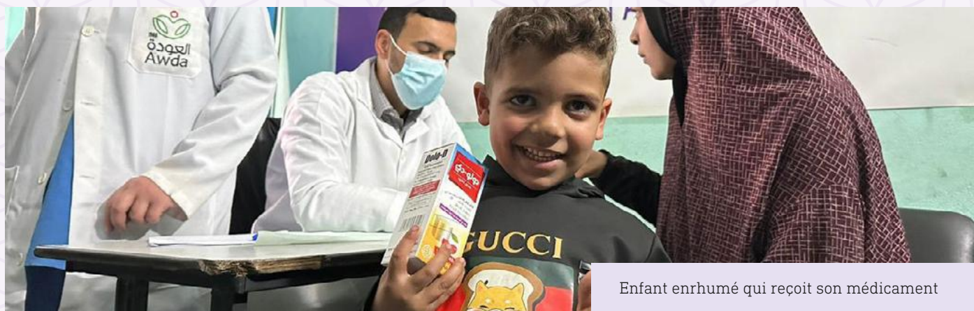
Enfant enrhumé qui reçoit son médicament