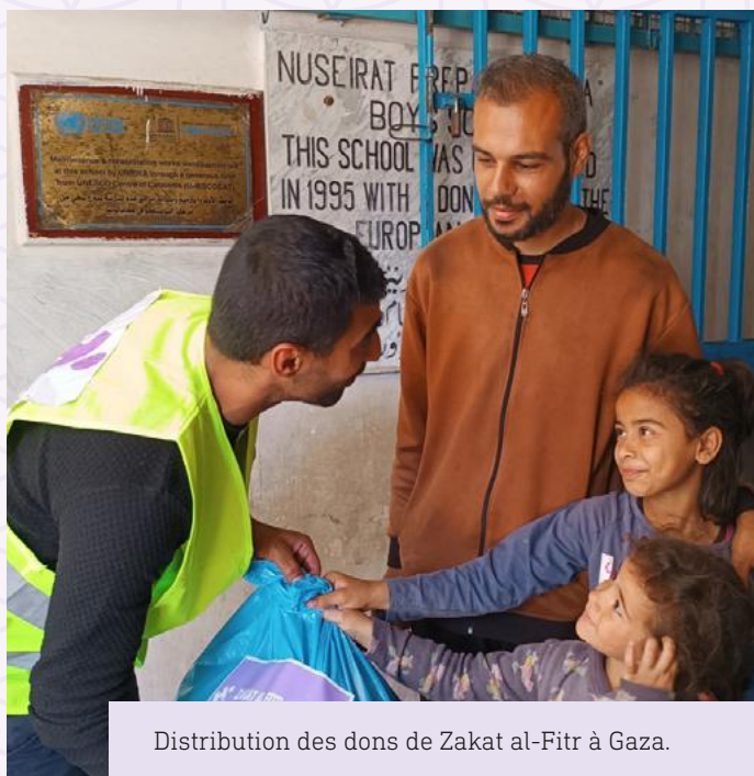
Distribution des dons de Zakat al-Fitr à Gaza.