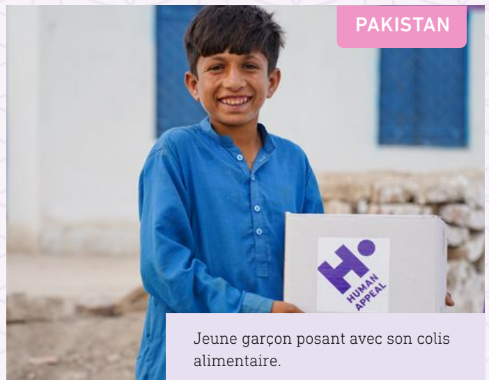
Jeune garçon posant avec son colis alimentaire.