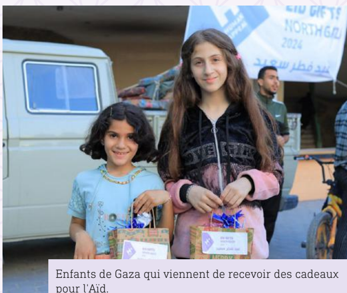
Enfants de Gaza qui viennent de recevoir des cadeaux pour l'Aïd.